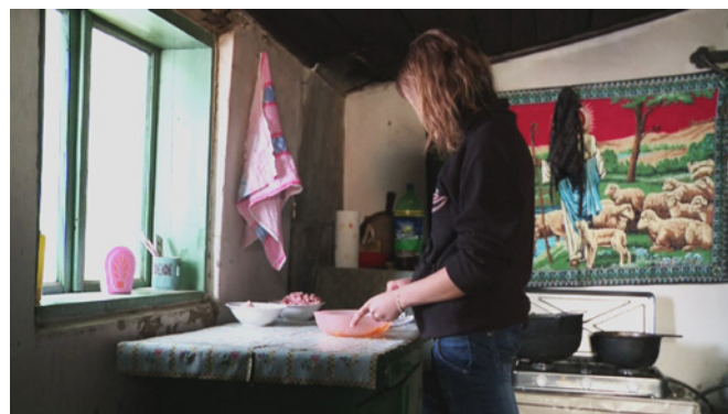
Druga mama