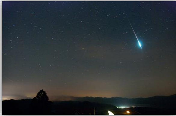
Vir: Boste opazovali zvezdne utrinke? www.dolenjskilist.si

Kaj me zanima? Kaj lahko raziskujemo? Kako je povezano? Ali se strinjam...? Kaj pa, če bi...?