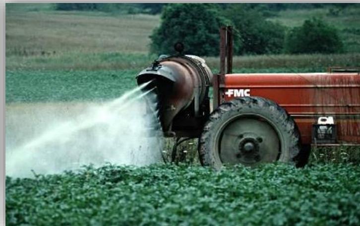
Vir: Pomanjkanje vode – sanitarna tveganja http://novebiologije.wikia.com/wiki/Pomanjkanje_vode_%E2%80%93_sanitarna_tveganja