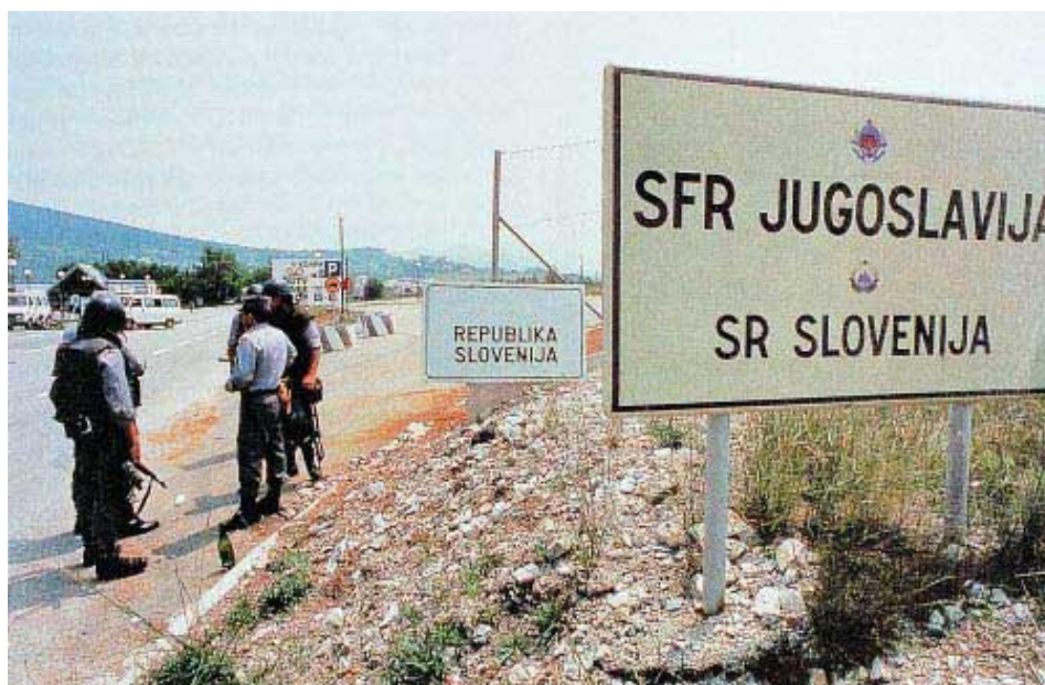
Slika 8: JLA je skušala zasesti vse mejne prehode v Sloveniji.