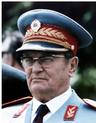
Slika 1: Josip Broz - TITO

Po smrti jugoslovanskega predsednika Josipa Broza Tita v državi ni prišlo do nujnih političnih in geografskih sprememb. Novi politiki so hoteli obdržati enak sistem vladanja, ki ga je imel Tito. Njihovo geslo je bilo »Tudi po Titu Tito!«