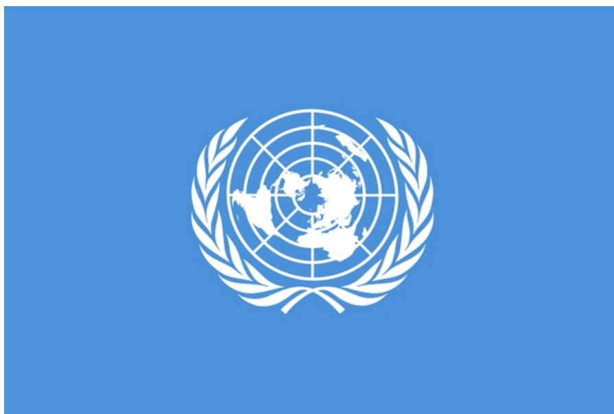
Slika 9: Zastava Združenih narodov

Sloveniji so bile najbolj naklonjene države Nemčija, Avstrija in Vatikan, skratka tiste, ki so imele dober vpogled v slovenske razmere. Samostojna in mednarodno priznana slovenska država je največji dosežek Slovencev v vsej zgodovini, ki so zaupali vase in izkoristili ugodne mednarodne razmere.