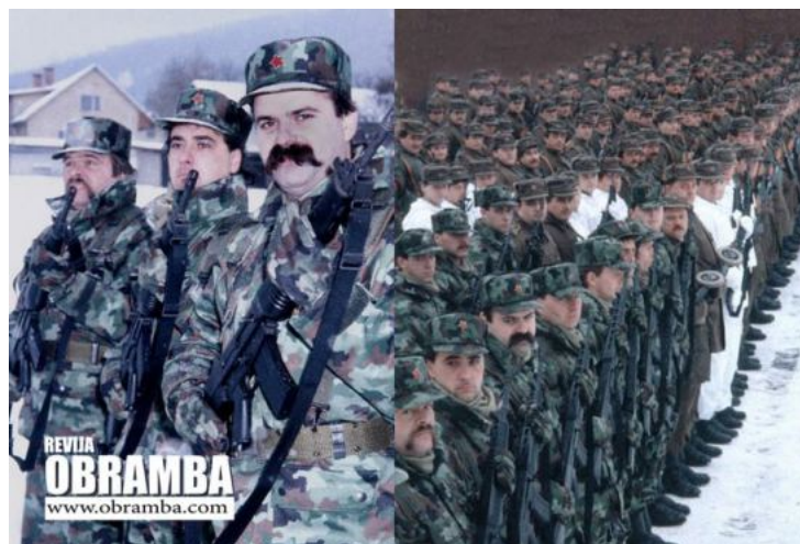
Slika 5: Jugoslovanska ljudska armada

V Republiki Sloveniji je delovalo tudi približno 150 pripadnikov vojaške varnostne službe (KOS), ki so bili po nacionalnosti v večini Srbi (90 %). 18