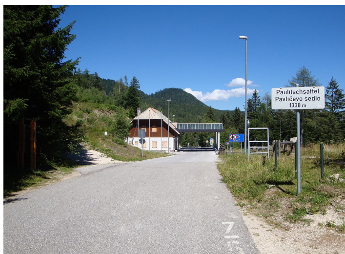
Slika 10: Mejni prehod Pavličevo sedlo

Mejni prehod Pavličevo sedlo je bil zaseden prvi s strani TO. Omogočena je bila prva svobodna povezava s tujino. Zasedbo mejnega prehoda je vodil kapetan Viktor Knaus, ki je s svojim moštvom stanje na stražarnici že dalj časa opazoval. Vodja nekdanje karavle JA je bil komandir Luković, ki je bil znan kot odločen vojak. Del meje z Avstrijo je bil že nekaj časa pod nadzorom TO, zato niso bila potrebna pogajanja med kapetanom Knausom in komandirjem Lukovićem, ki se je po kratkih pogajanjih z vojaki predal brez izstreljenega strela. 47