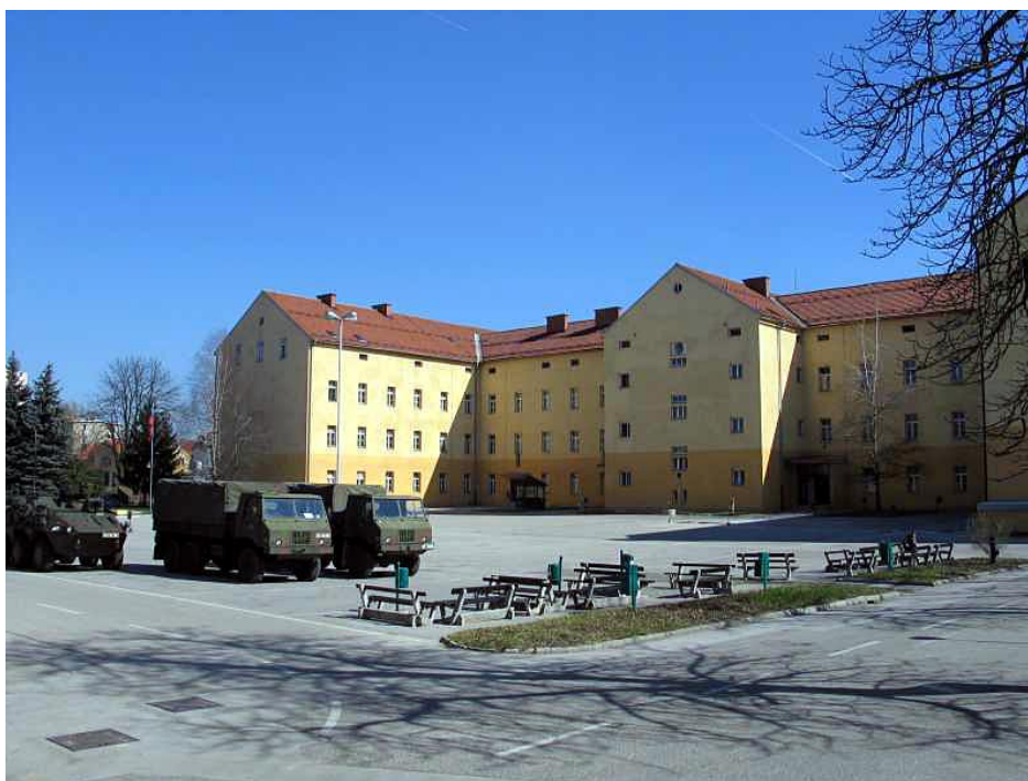
Slika 11: Vojašnica Celje

Pogovori so potekali okrog predaje orožja TO, ki je bilo skladiščeno v objektih TO v Bukovžlaku, pozneje še o možnostih prestopa in predaje pripadnikov JA. Po dokončni postavitvi blokade vojašnice je sledil odklop elektrike, vode in telefonske povezave. Po okoliških stavbah so bile postavljene opazovalnice TO z nalogo, da opazujejo premike v vojašnici. 49