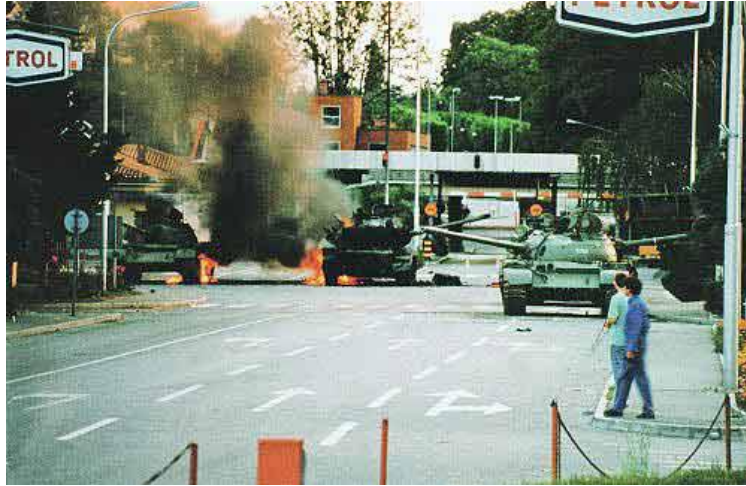
Slika 7: Goreči tanki na mejnem prehodu Rožna dolina pri Novi Gorici.