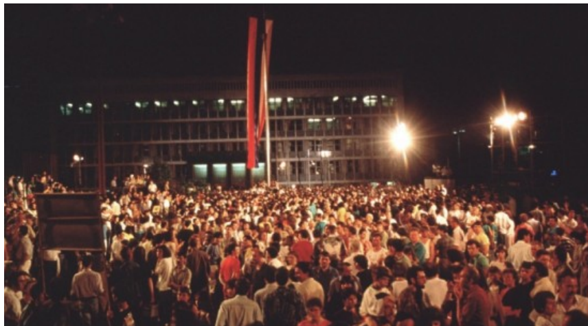
Slika 3: Razglasitev samostojnosti in neodvisnosti Republike Slovenije

Slovenski parlament je 25. junija 1991 sprejel deklaracijo - listino o samostojnosti in o neodvisnosti Republike Slovenije in še nekaj s tem povezanih zakonov. Samostojnosti n neodvisnost so proglasili na svečani razglasitvi, ki je potekala dan pozneje, in sicer 26. Junija 1991, na največjem ljudskem shodu v Sloveniji, na Trgu republike v Ljubljani.