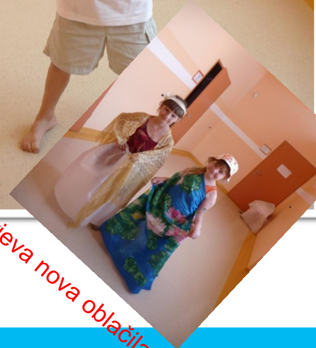
Cesarjeva nova oblačila